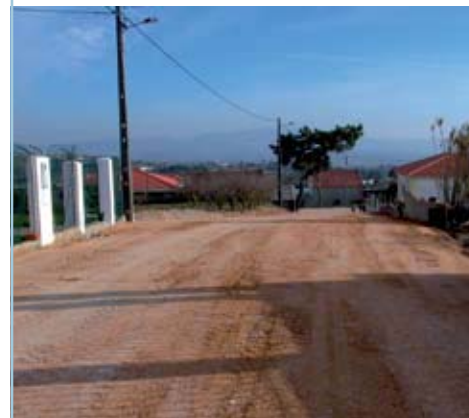
USSEIRA Preparação para colocação de asfalto na Rua do Talefe