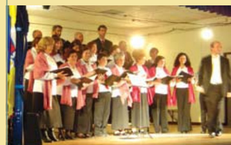
Grupo Coral Alma Nova