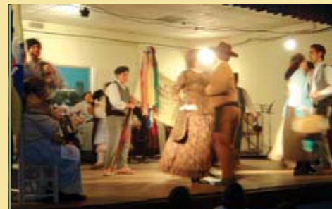
Rancho Folclórico Estrelas do Arnóia