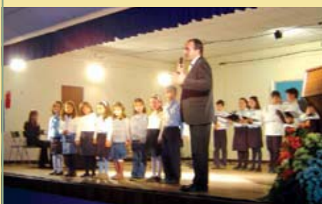
Coro Infantil de Óbidos