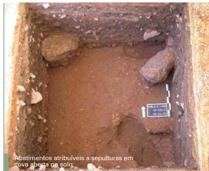
Abatimentos atribuíveis a sepulturas em cova aberta no solo