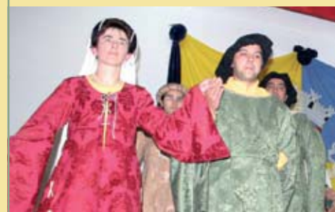
Grupo de Danças Antigas Josefa de Óbidos