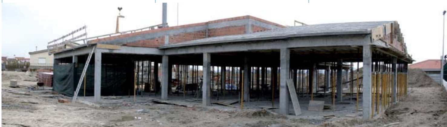
AMOREIRA As obras de construção do novo jardim-de-infância da Amoreira continuam a bom ritmo