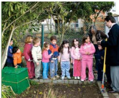
Educar para o Ambiente (Amoreira) Rede de Centros de Compostagem