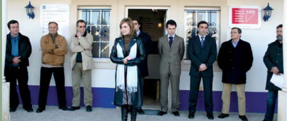
1 Cerimónia de inauguração do CIS