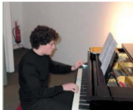
Espectáculo Jovens Músicos de Óbidos Galeria novaOgiva