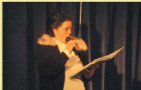
Poetisa Popular Carminda Carreira