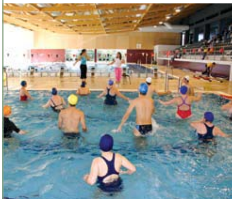
Festival da Escola de Nataçao Piscinas Municipais de Óbidos