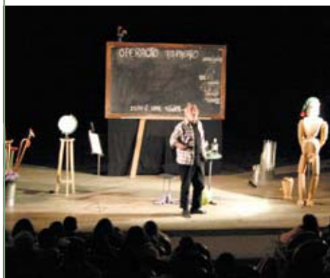
Teatro "Desconcerto Ginfónico" Auditório Municipal Casa da Música