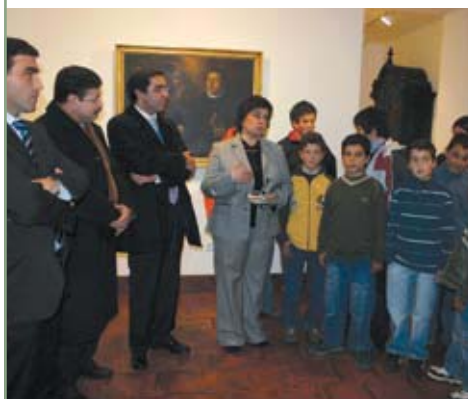
Apresentação do Clube de História e Património Local - Museu Municipal