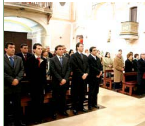
Missa na Igreja de S. Pedro Feriado Municipal