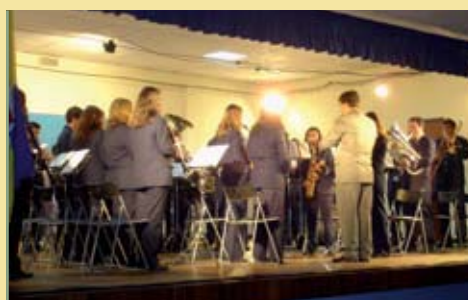
Banda Sociedade Filarmónica Gaeirense