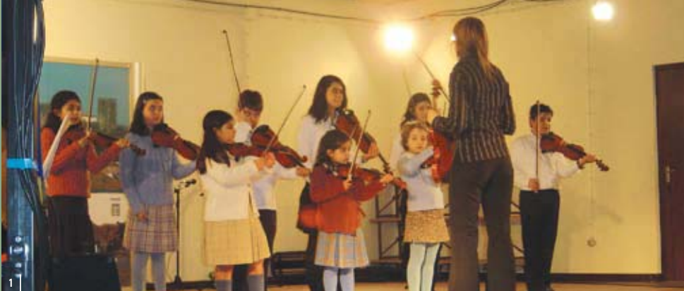
Escola de Música de Óbidos classe de violino 1