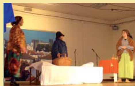
Grupo de Teatro Fracos mas Teimosos