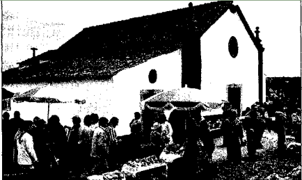
ÓBIDOS FESTEJA SANTO ANTÃO

Instituídas comemorações do Feriado Municipal de Óbidos, vai ser inaugurada, no próximo dia 11, pelas 16h00, as novas instalações do Museu Municipal de Óbidos, no Solar da Praça da Santa Maria.