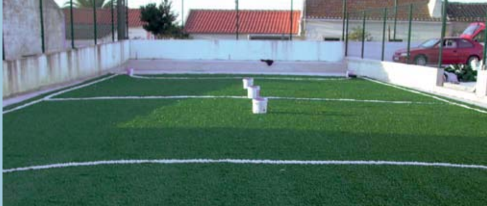
SOBRAL DA LAGOA Colocação e pintura do novo relvado sintético na Escola do 1.º ciclo