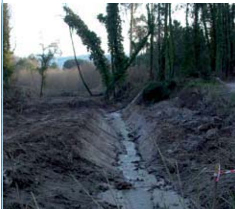
CASAIS CAMARNAIS Trabalhos de limpeza de linhas de água