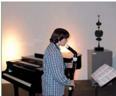
Espectáculo Jovens Músicos de Óbidos Galeria novaOgiva