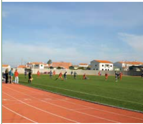
Troféu Amizade Sénior (Estádio Municipal) Óbidos Sport Clube e S.C.R. Gaiense