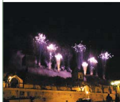
Fogo de artifício na Vila de Óbidos Feriado Municipal