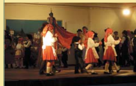
Rancho Folclórico Infantil Os Populares do Olho Marinho