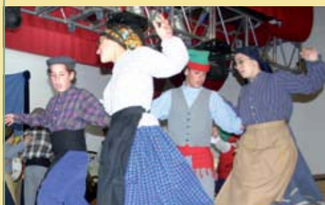
Rancho Folclórico do Arelho