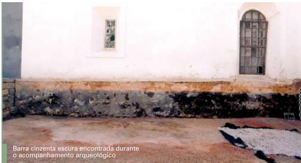
Barra cinzenta escura encontrada durante o acompanhamento arqueológico

O Gabinete de Arqueologia realizou uma intervenção de emergência no terreiro adjacente à Igreja de São Tiago, entre Março e Maio de 2005. Esta acção foi motivada pelo arranque da primeira campanha de obras do projecto de beneficiação da Igreja, que envolvia trabalhos de desaterro no referido terreiro. Na primeira fase da intervenção, procedemos à caracterização arqueológica da área do projecto de beneficiação, mediante a escavação de zonas estratégicas até aproximadamente 1.45 m de profundidade (sem atingir o nível