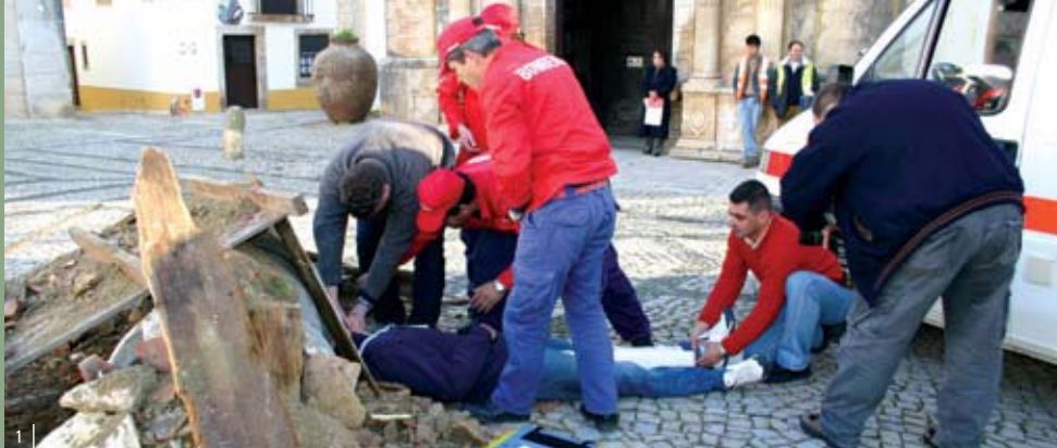
Simulacro de sismo na Praça de Sta. Maria 1 A CPCJ está a organizar a iniciativa "Conversas ao fim da tarde" 2