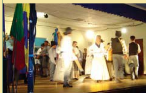
Rancho Folclórico Os Populares do Olho Marinho