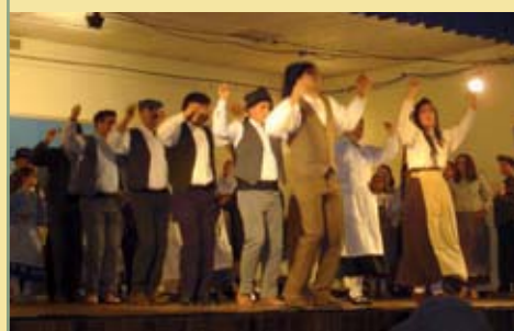
Rancho Folclórico da Capeleira