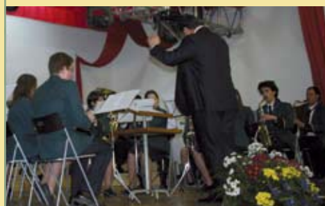
Banda da Sociedade Musical e Recreativa Obidense