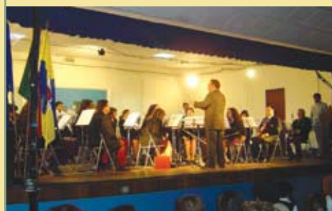
Banda União Filarmónica de A-da-Gorda