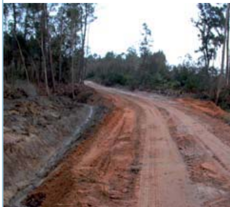
CASAIS CAMARNAIS Alargamento de estrada nesta freguesia das Gaeiras