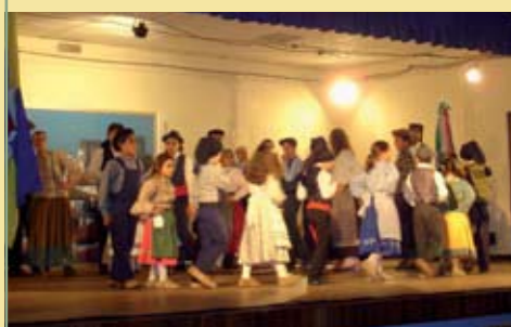
Rancho Folclórico Infantil da Capeleira