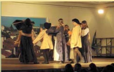
Grupo de Danças Antigas Corte na Aldeia