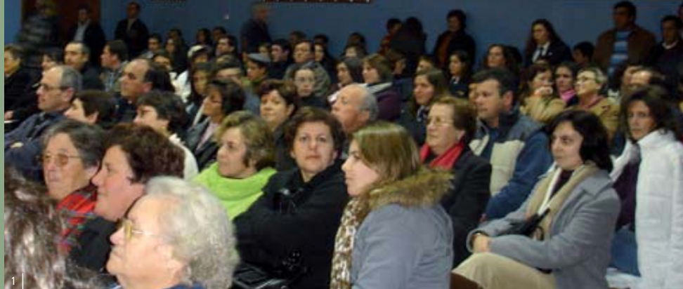
1 Muita gente assistiu às Galas de Óbidos